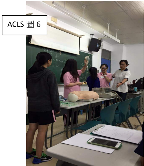
ACLS 圖 6