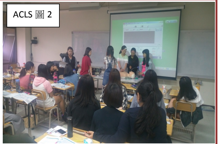
ACLS 圖 2