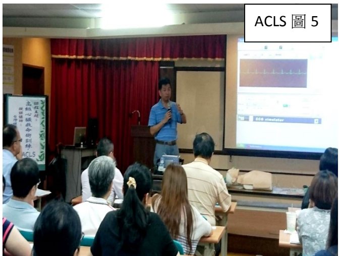
ACLS 圖 5