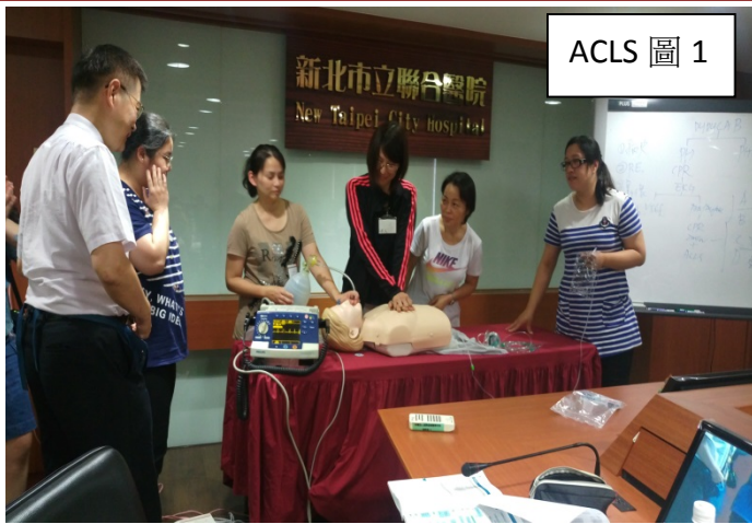
ACLS 圖 1