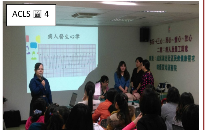
ACLS 圖 4